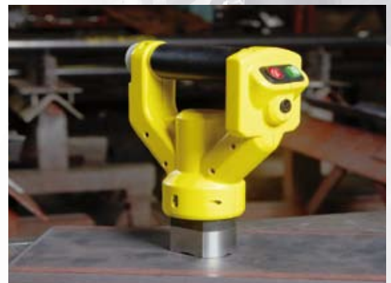
Bateriový zvedací magnet TMBL004001.