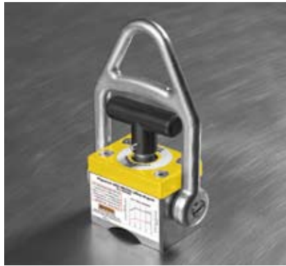
Zvedací systém TMHL pro zvedání těžkých břemen.

Magswitch řady TMHL (zvedací magnet) je ideální pro těžší zatížení a pro zvedání silnějších plechů. Tento zvedací magnet je vybaven otočnou rukojetí pro manipulaci ze strany. Magnet tak může být ručně zapínán i vypínán. Jako další bezpečnostní prostředek je přidán zámek, který brání nechtěnému zapnutí a vypnutí. Magnet je vybaven standardními pólovými nástavci, které jsou výměnné pro manipulaci s plochým nebo válcovým materiálem.