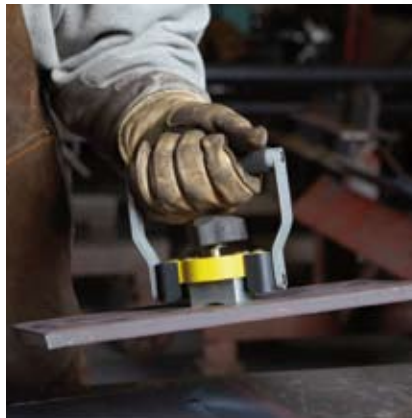
Ruční zvedací magnet TMHL004001.