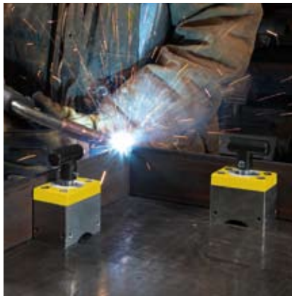
Uchycovací systém TMSQ pro manipulaci ocelových břemen.

Indikovaná zvedací síla je pro ideální okolnosti. Maximální dovolená zvedací síla závisí na analýze rizik, ale musí obsahovat alespoň bezpečnostní faktor 2.