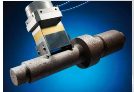
Magswitch magnet pneumaticky zapnutelné řady TMIS.