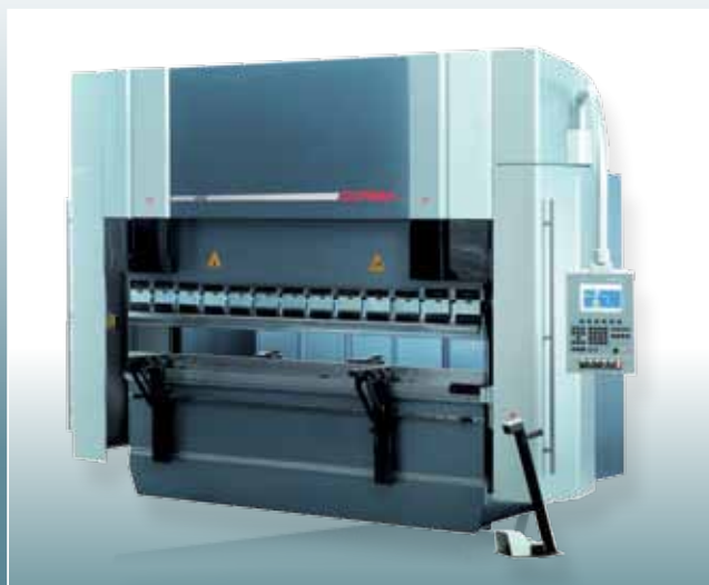
CNC ohraňovací lis ADS220