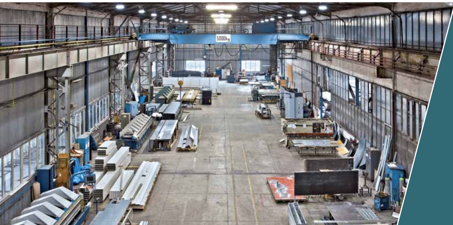
Výrobní hala Besta Trade

Výroba probíhá ve Frýdku-Místku na ulici Příborská, a to ve dvou halách o celkové ploše 2300 m 2 . Dodáváme do zemí celé EU.