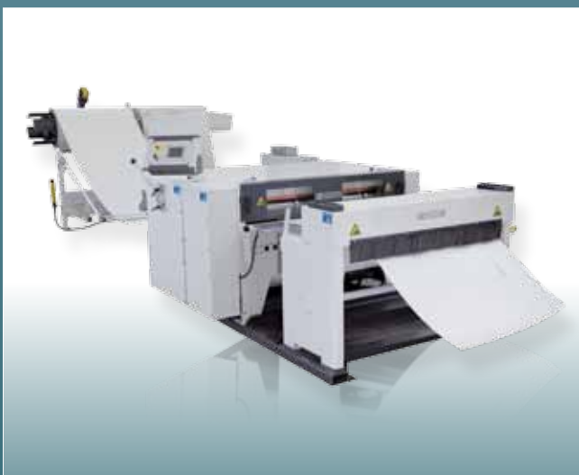
CNC linka na dělení plechu ze svitků