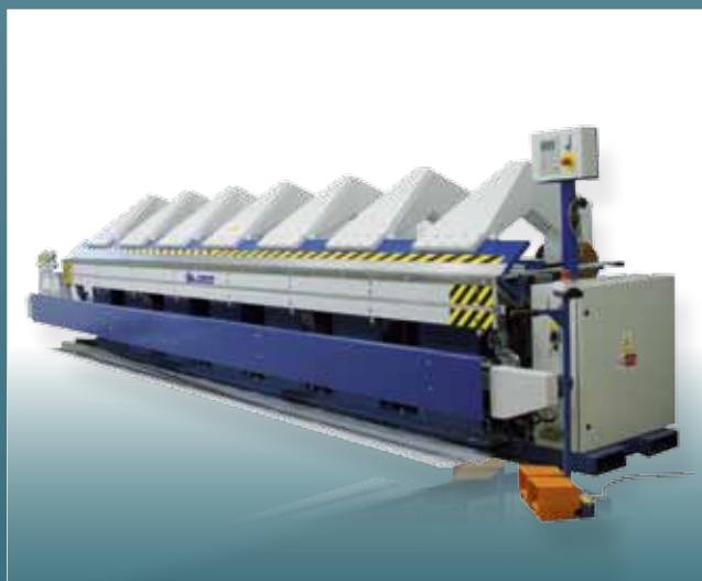
CNC ohýbačka délka 7000 mm