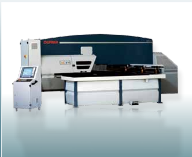
TP9 vysekávací lis